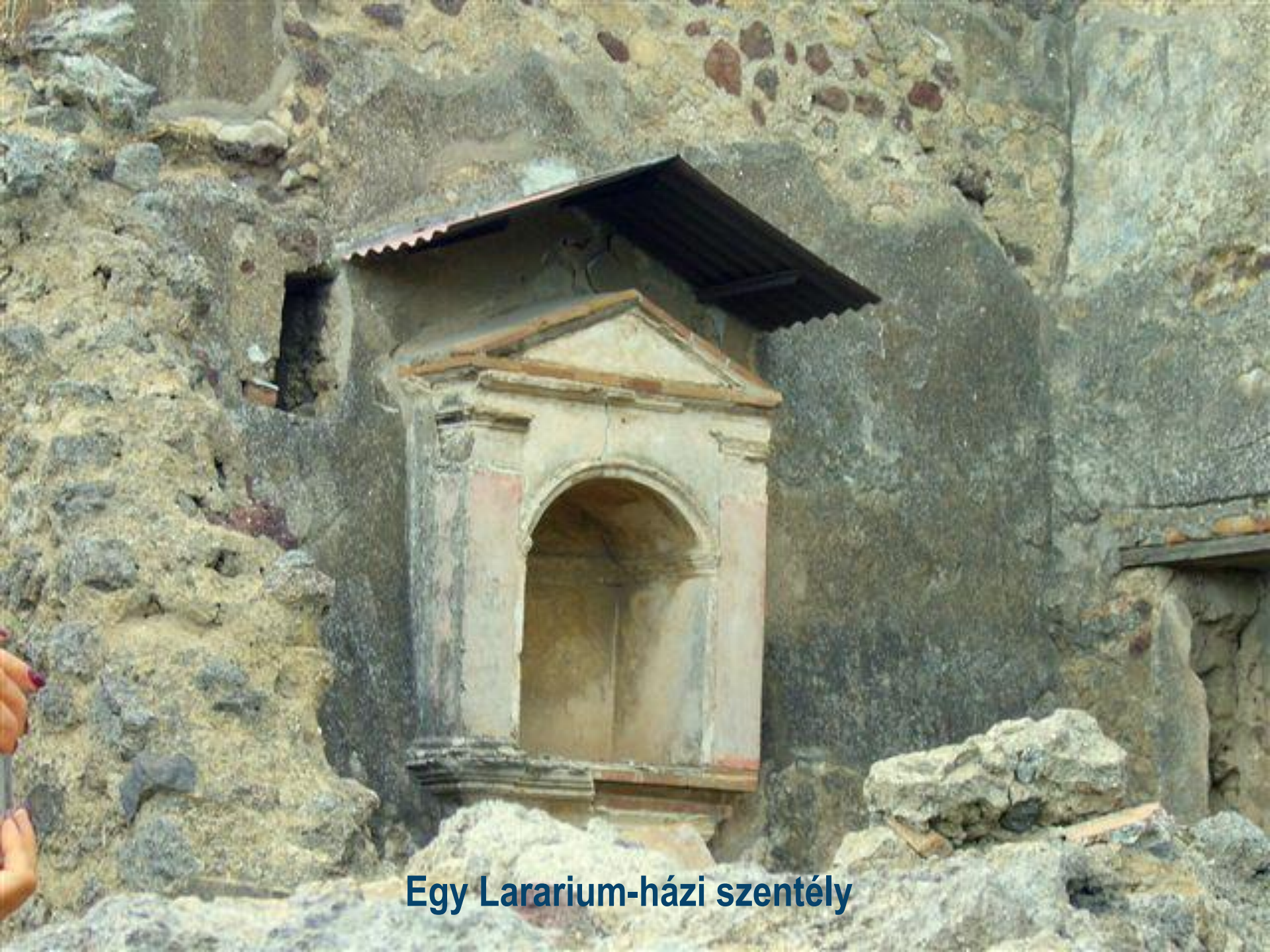
Egy Lararium-házi szentély