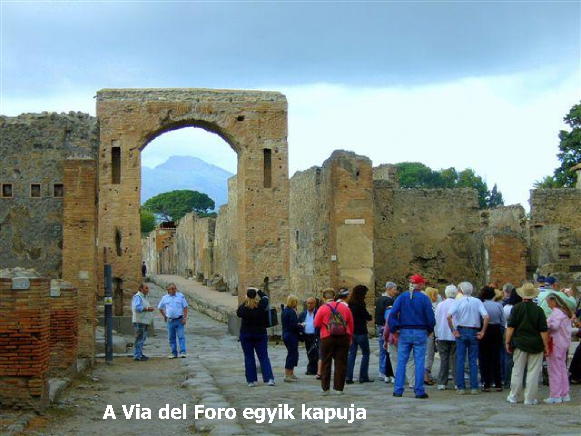
A Via del Foro egyik kapuja