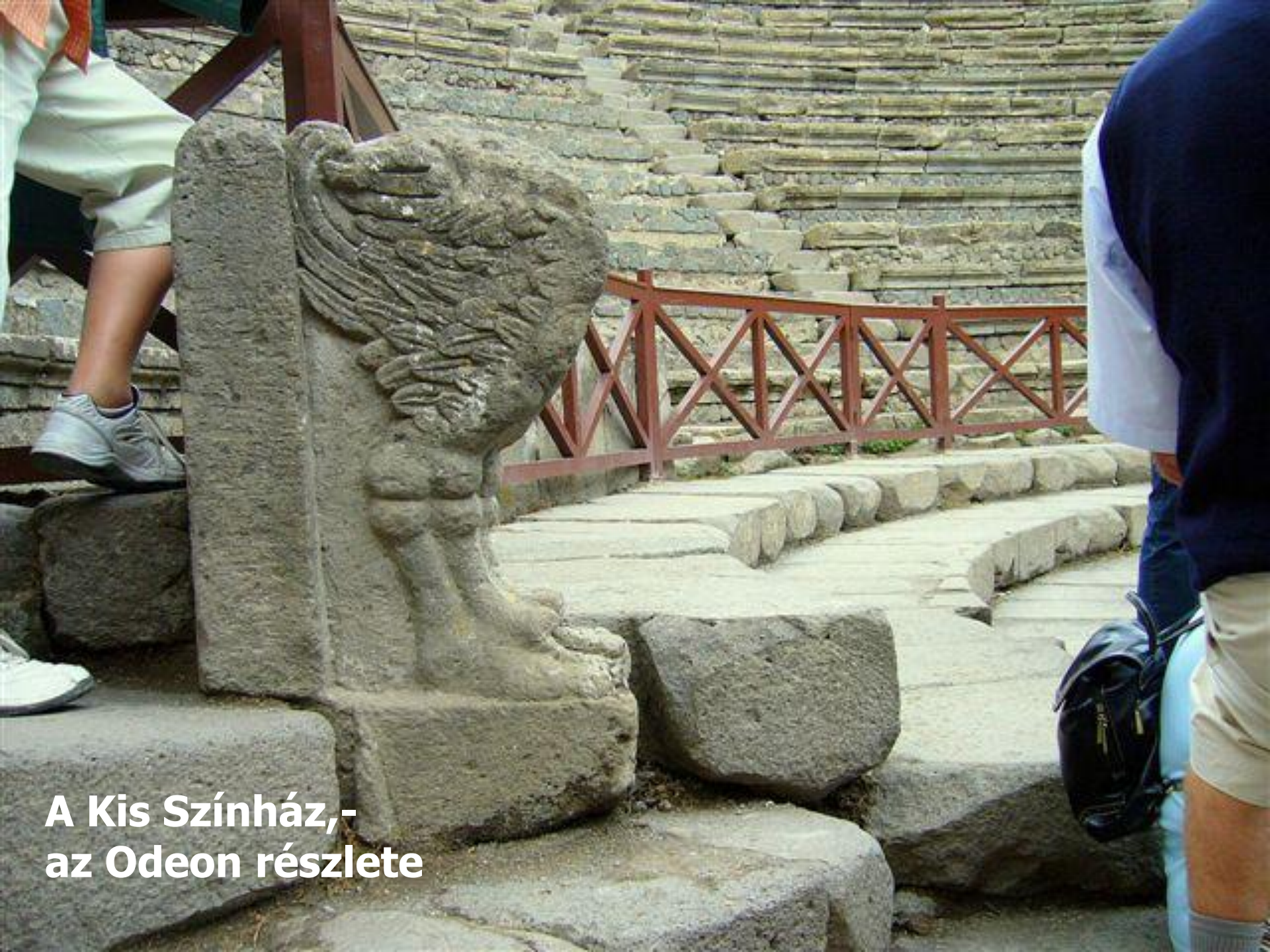
A Kis Színház,- az Odeon részlete