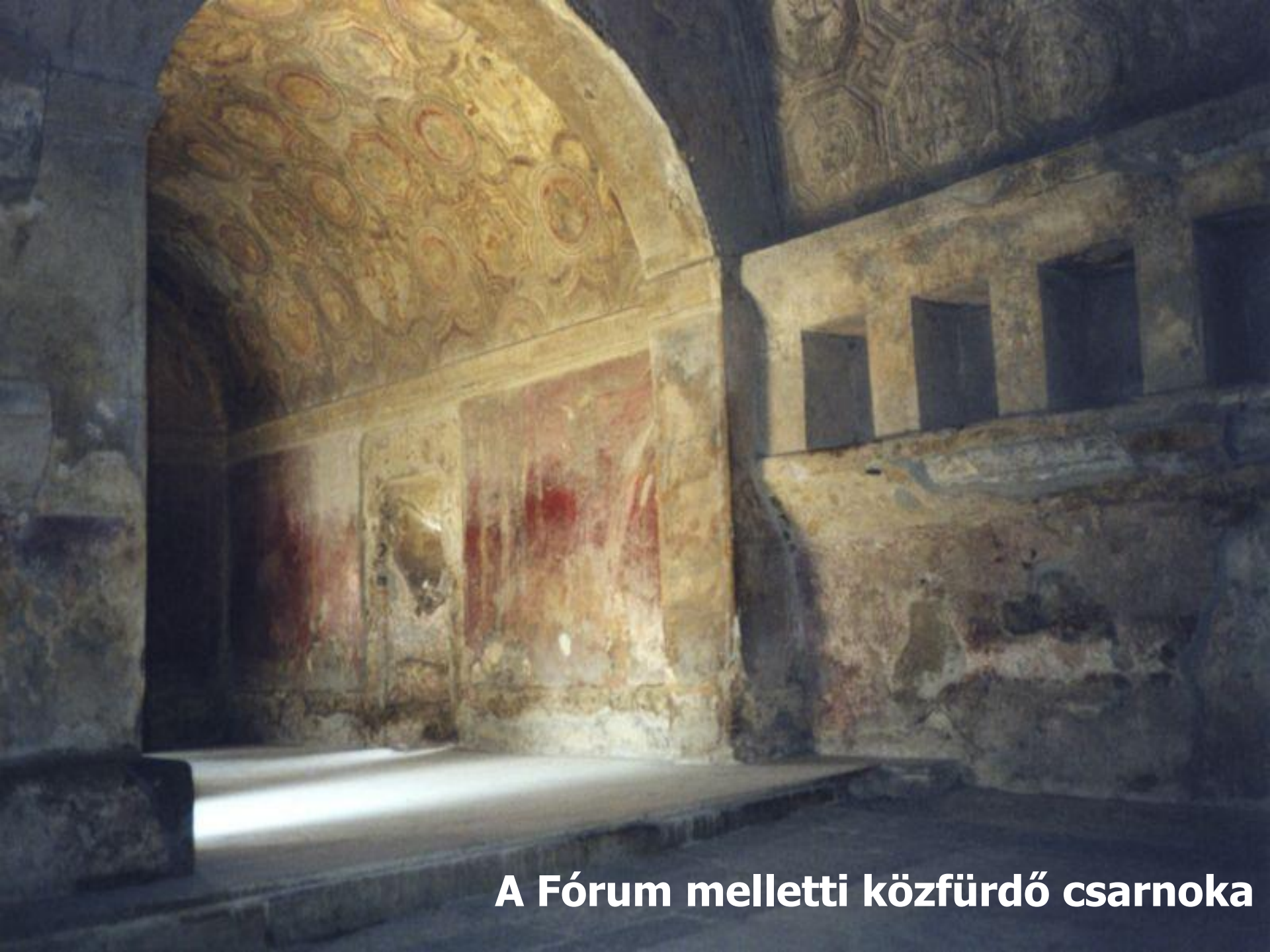
A Fórum melletti közfürdő csarnoka