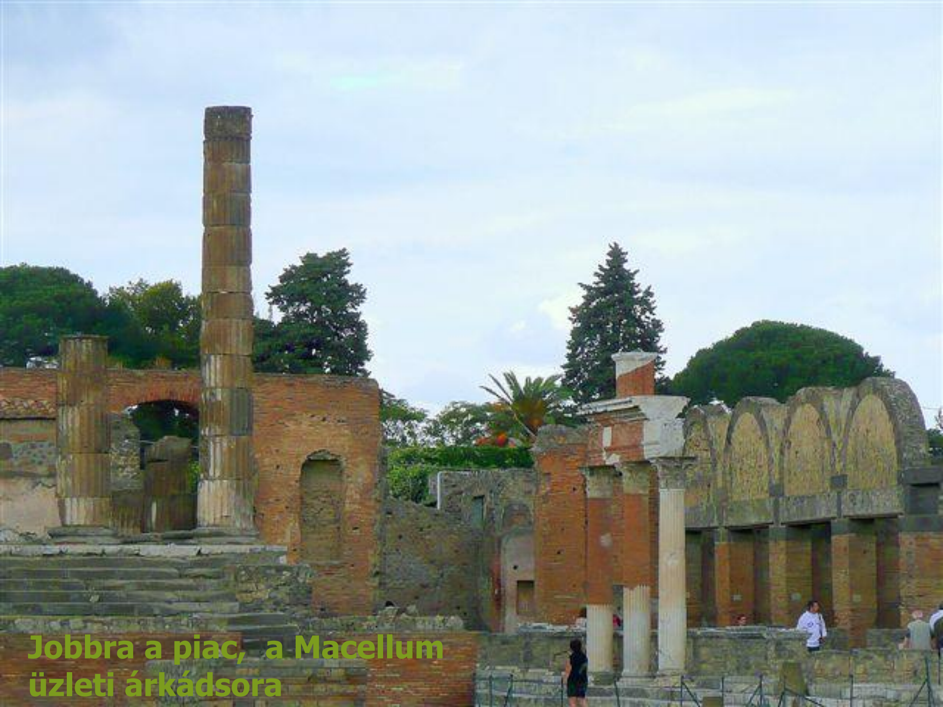
Jobbra a piac, a Macellum üzleti árkádsora