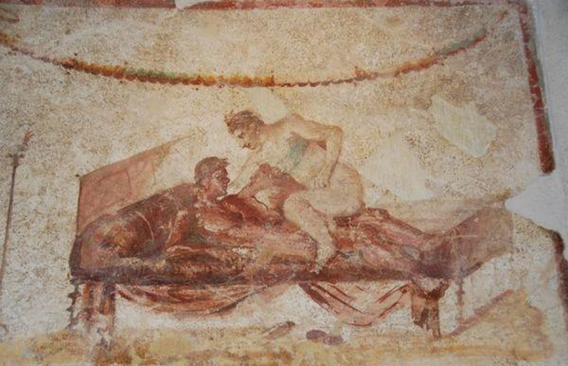
Egy nyilvánosház pornográf freskója