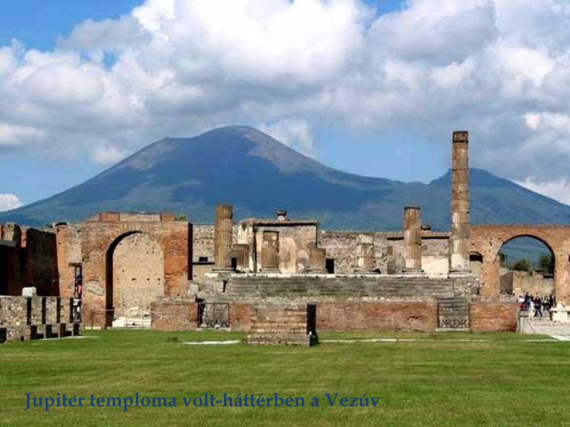
Jupiter temploma volt-háttérben a Vezúv