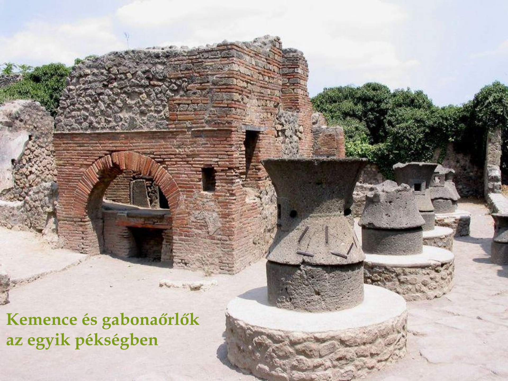
Kemence és gabonaórlók az egyik pékségben