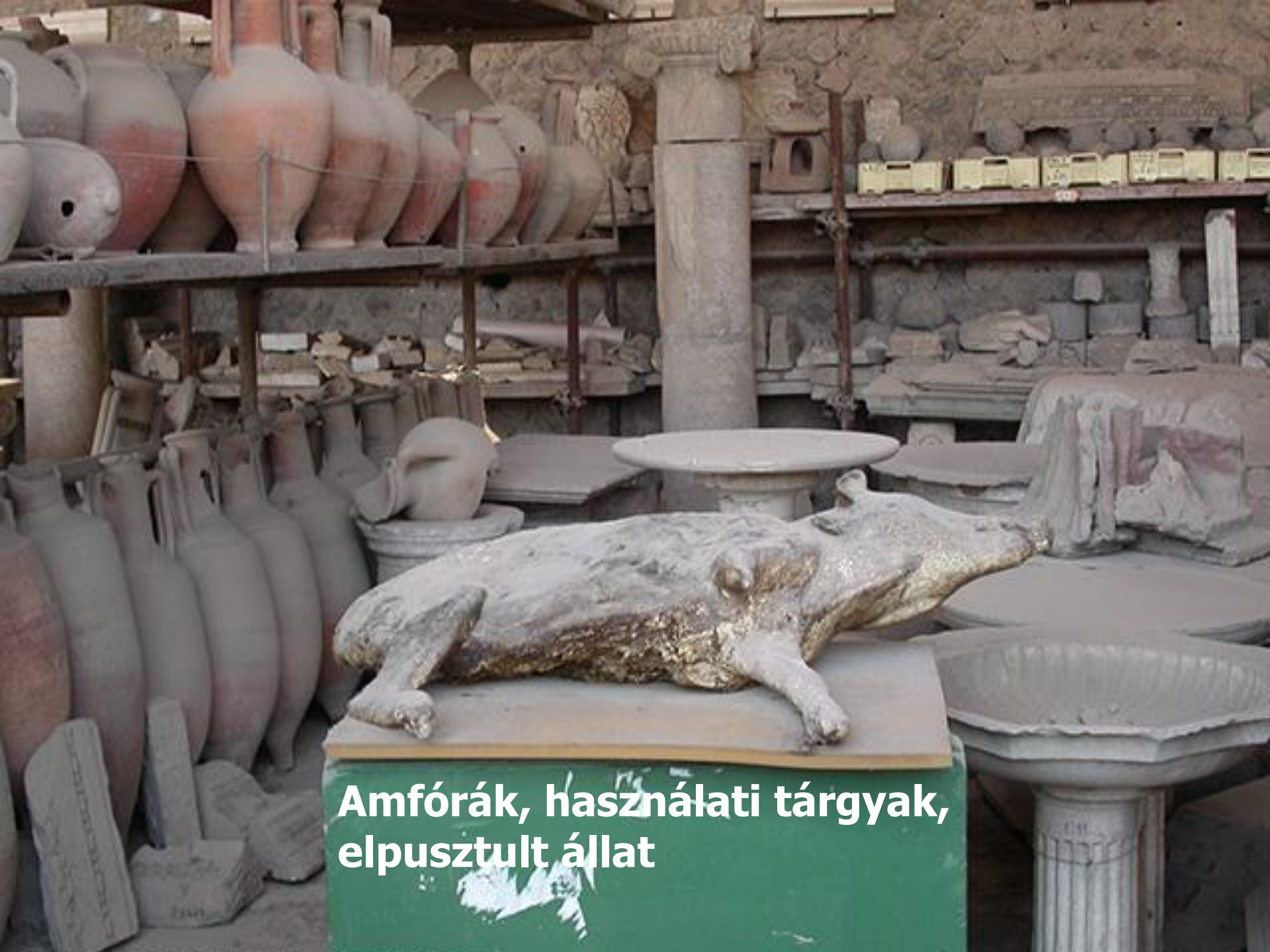
Amfórák, használati tárgyak, elpusztult állat