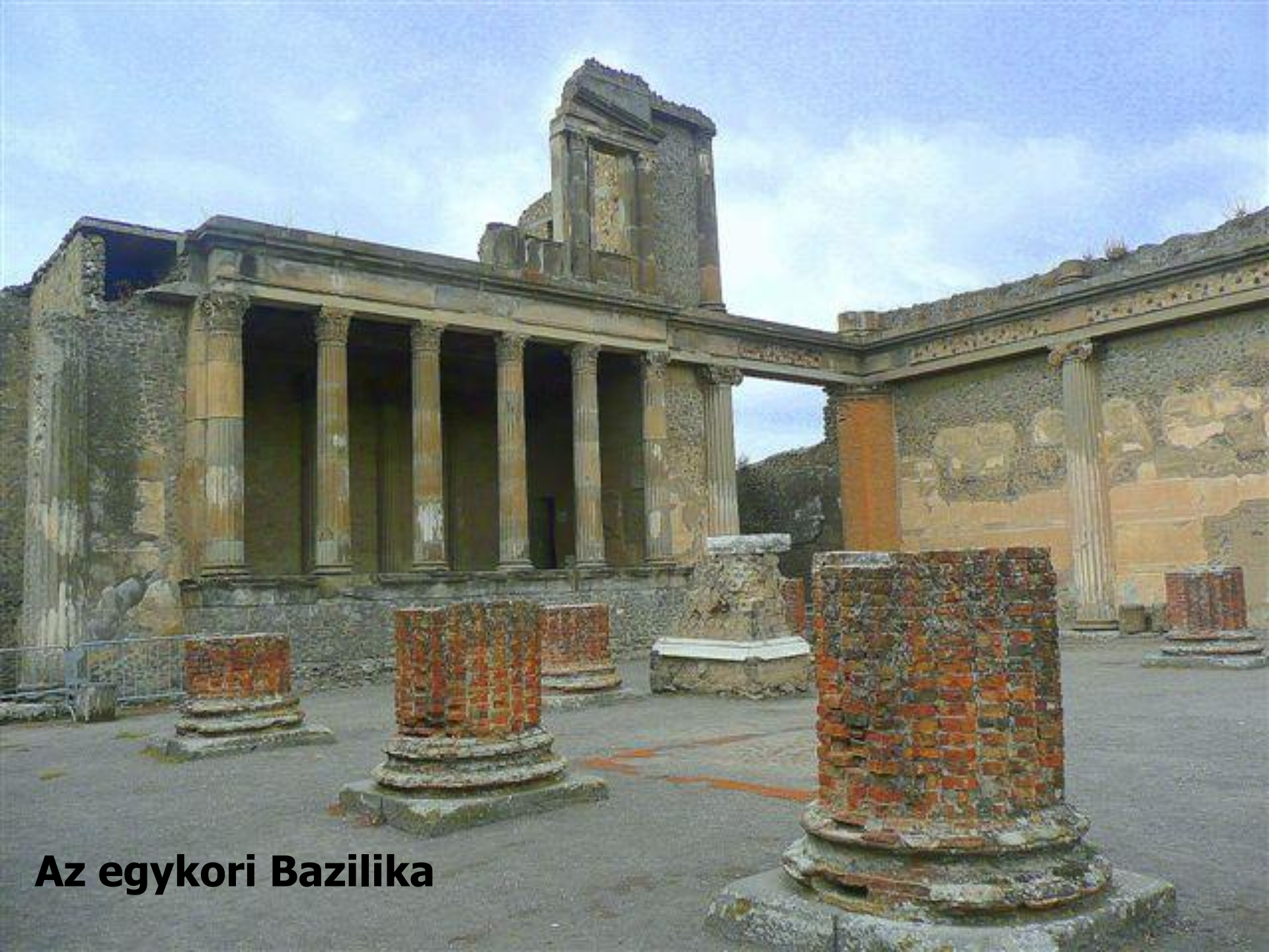
Az egykori Bazilika