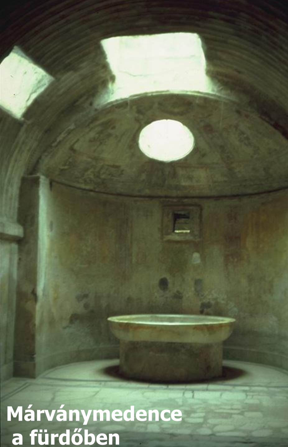
Márványmedence a fürdőben