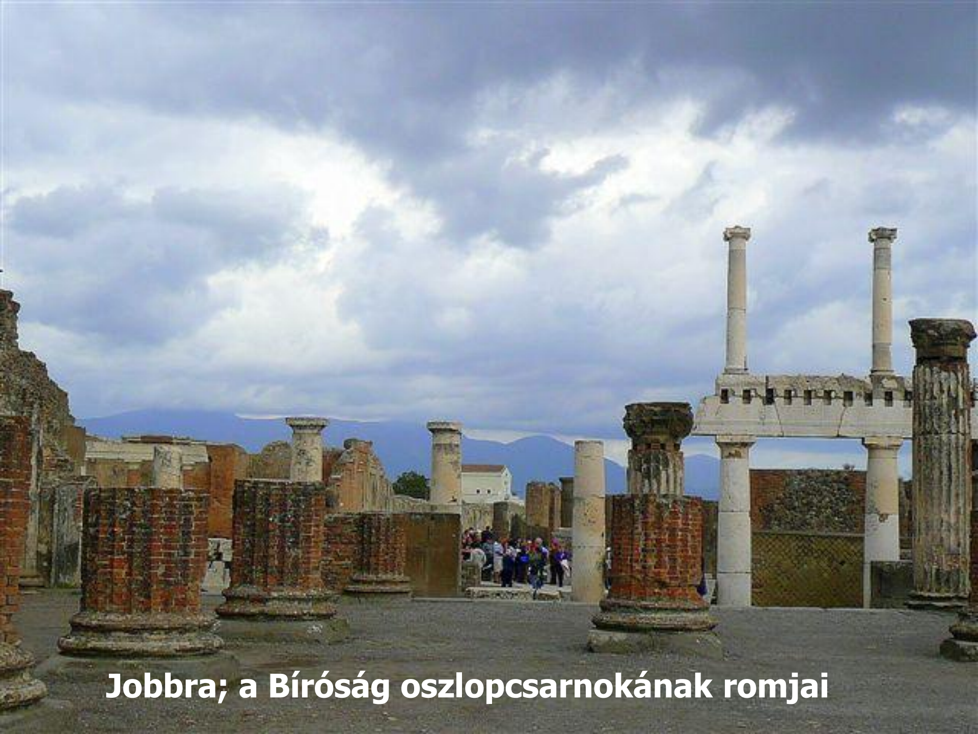
Jobbra; a Bíróság oszlopcsarnokának romjai